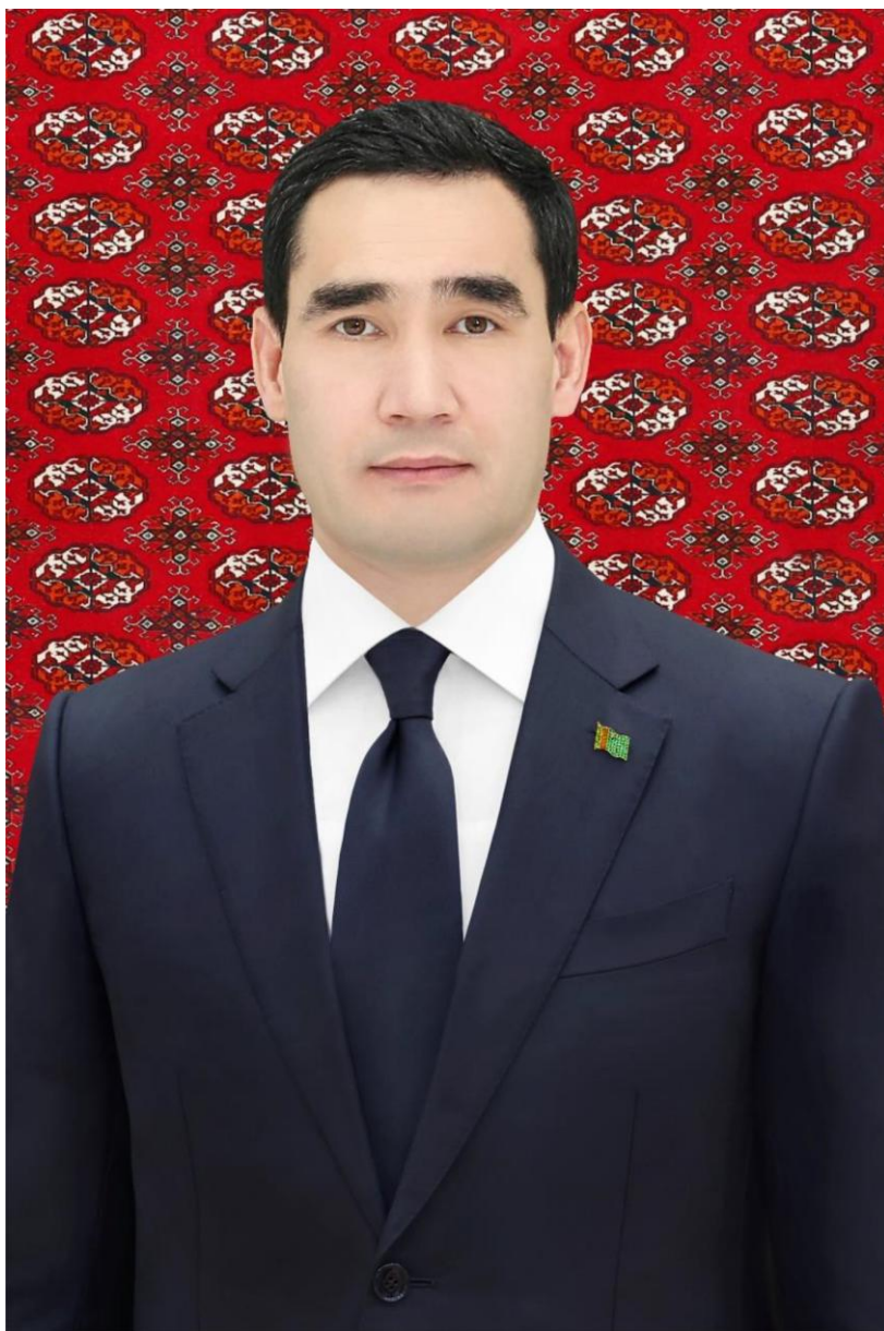
TÜRKMENISTANYŇ PREZIDENTI SERDAR BERDIMUHAMEDOW