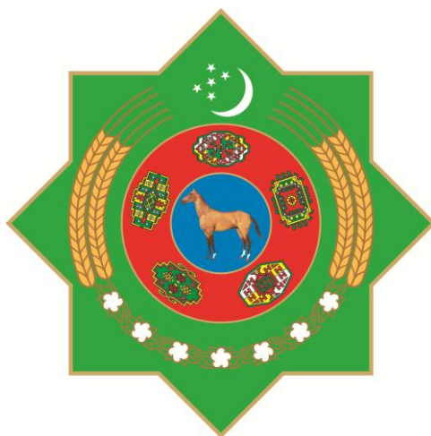
TÜRKMENISTANYŇ DÖWLET TUGRASY