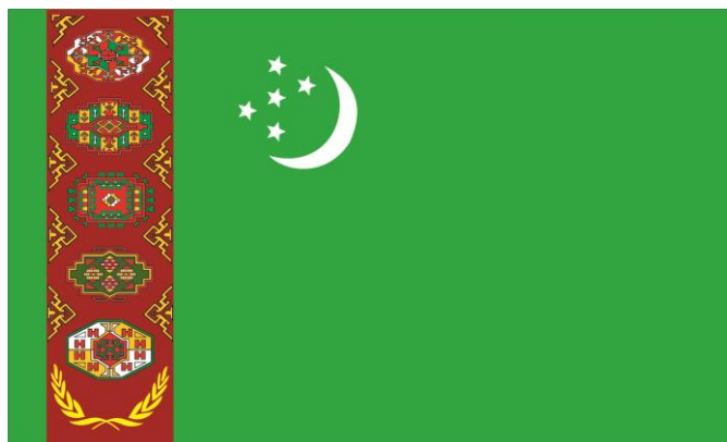
TÜRKMENISTANYŇ DÖWLET BAÝDAGY